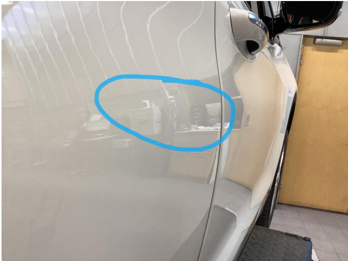
1.1 Lakksig høyre bakdør