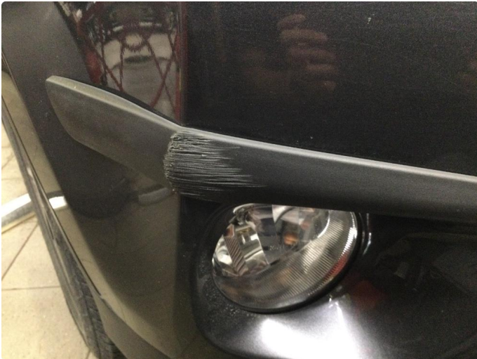
1.1 Ripe(r) ned til grunning