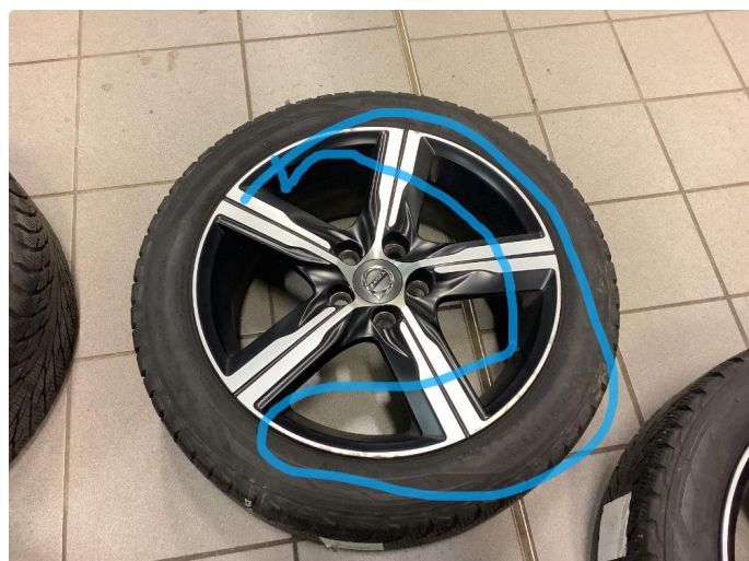
1.2 Kantkjørt felg Diamond Cut