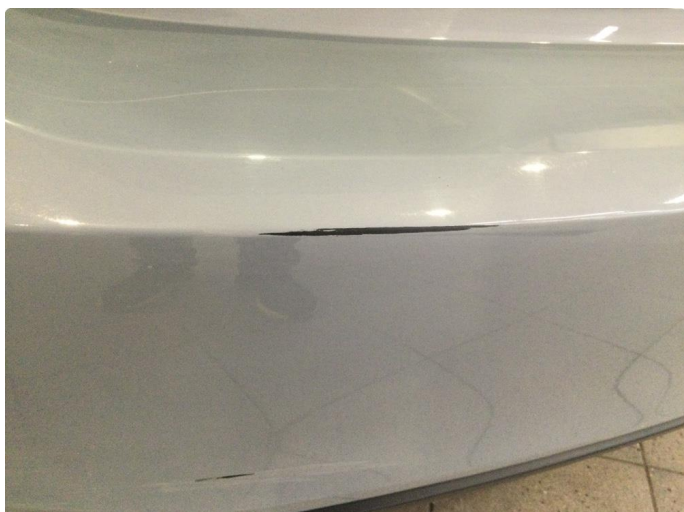
1.1 Ripe(r) ned til grunning