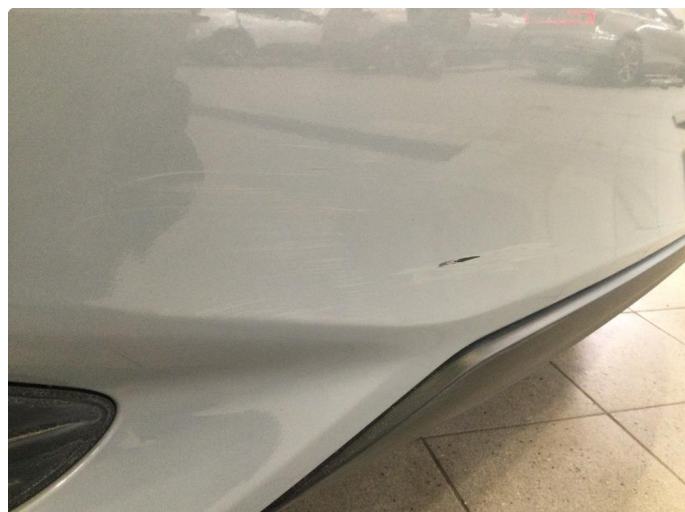
1.1 Ripe(r) ned til grunning