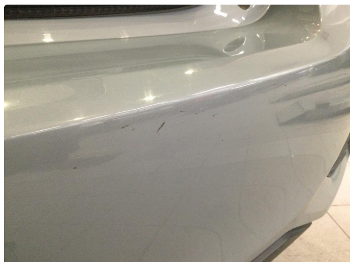
1.1 Ripe(r) ned til grunning