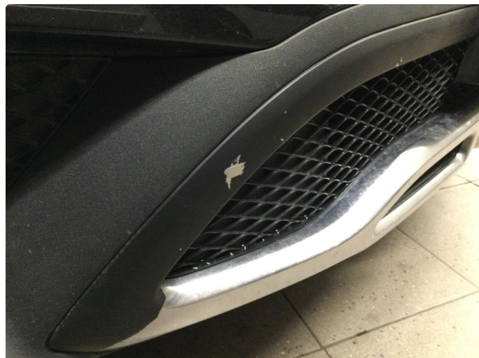
1.3 Lite lakkavslag