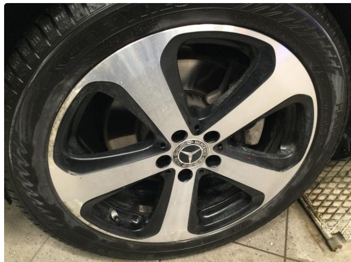
1.2 Kantkjørt felg