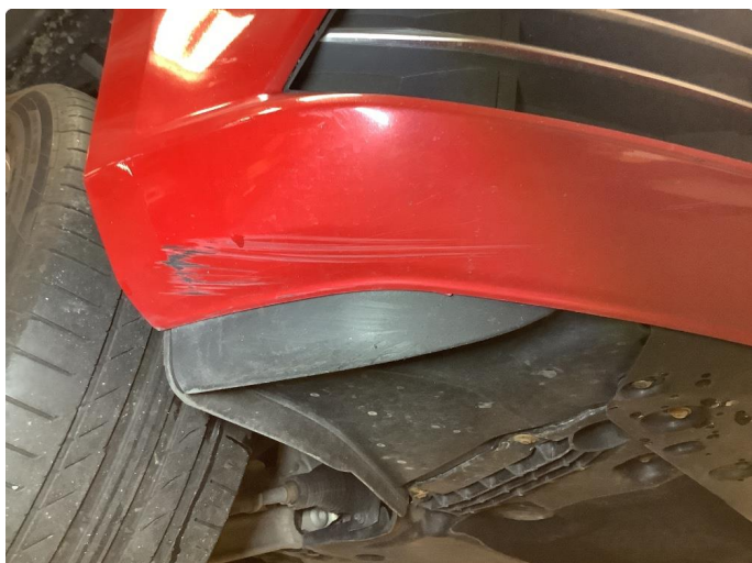
1.1 Skrubbing underkant