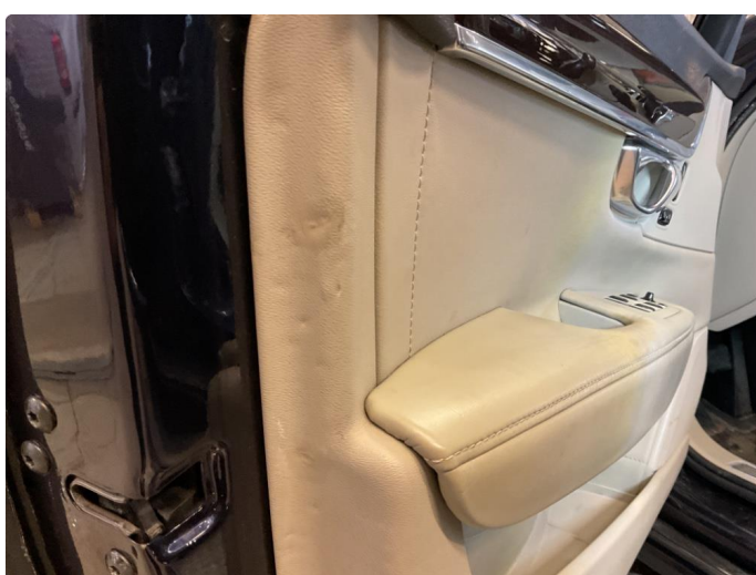
2.1 Skadet/merker etter utstyr