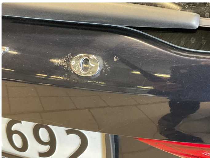
1.1 Ufagmessig utført arbeid