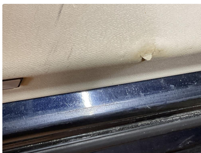
2.1 Skadet/merker etter utstyr