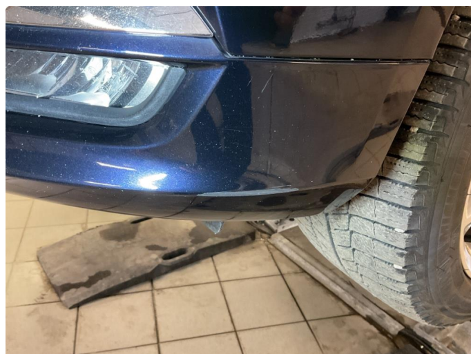
1.3 Lakk flasser