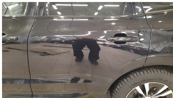
1.1 Bulk med lakkskade