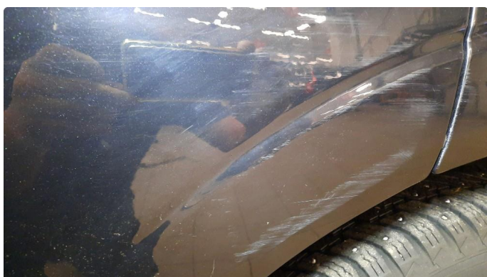
1.1 Bulk med lakkskade