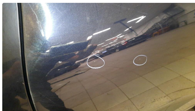
1.1 Bulk med lakkskade