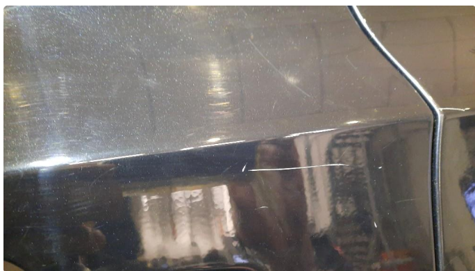
1.1 Bulk med lakkskade