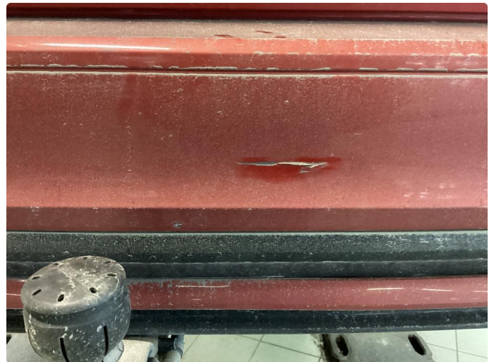
1.1 Ripe(r) ned til grunning