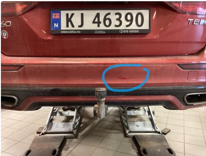
1.1 Ripe(r) ned til grunning