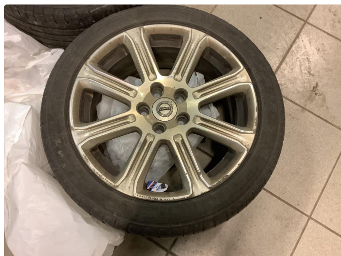
1.2 Kantkjørt felg