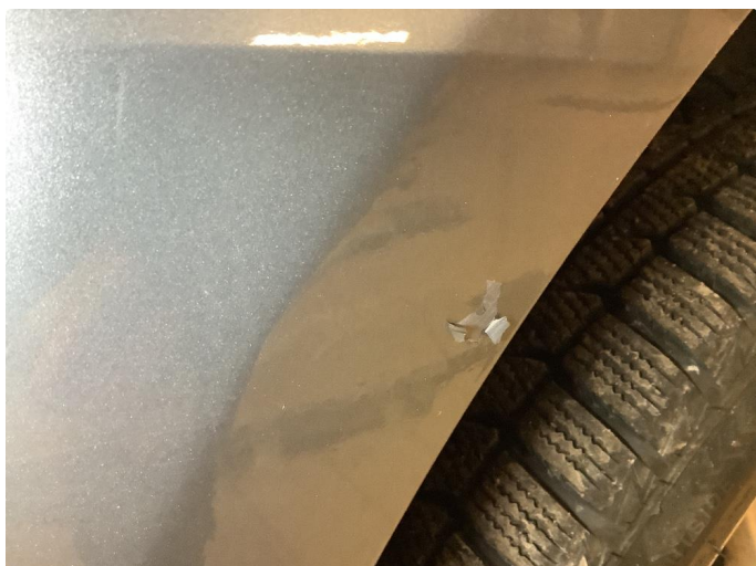
1.1 Lakk flasser