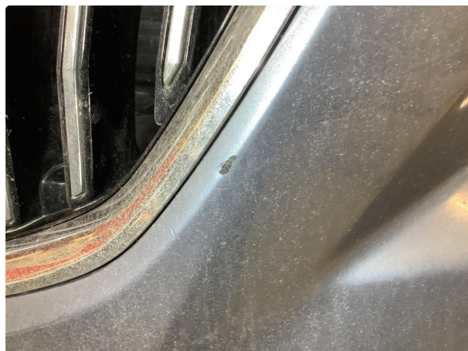
1.1 Lakk flasser