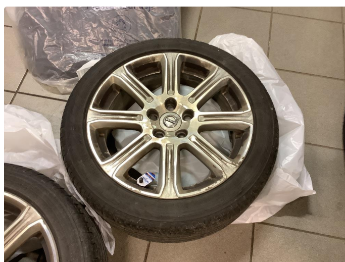
1.2 Kantkjørt felg