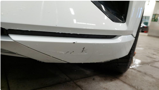
1.1 Skrubb fangerhjørne venstre foran