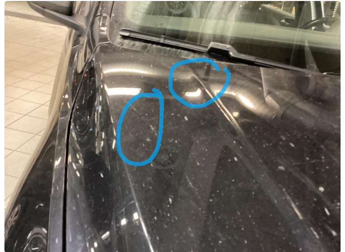
1.1 Flere bulker