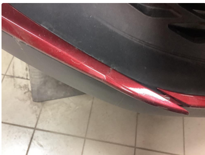
1.3 Øvrige feil