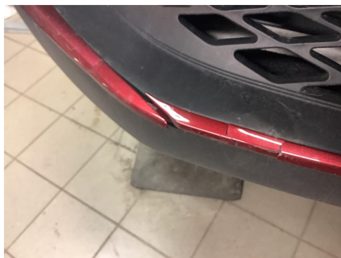
1.3 Øvrige feil