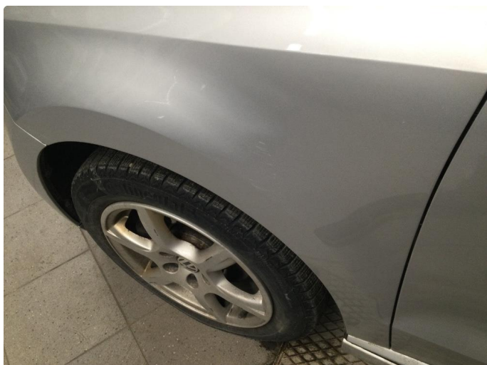
1.1 Bulk med lakkskade