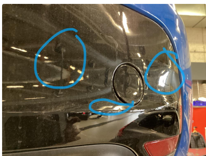
1.3 Bulk med lakkskade