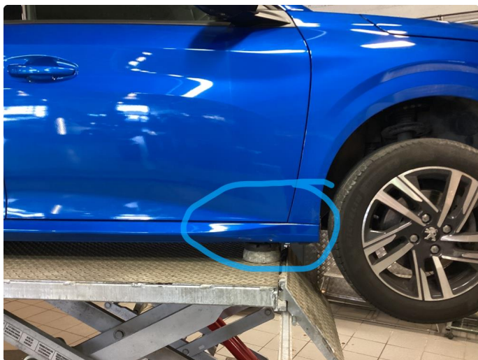
1.4 Bulk med lakkskade