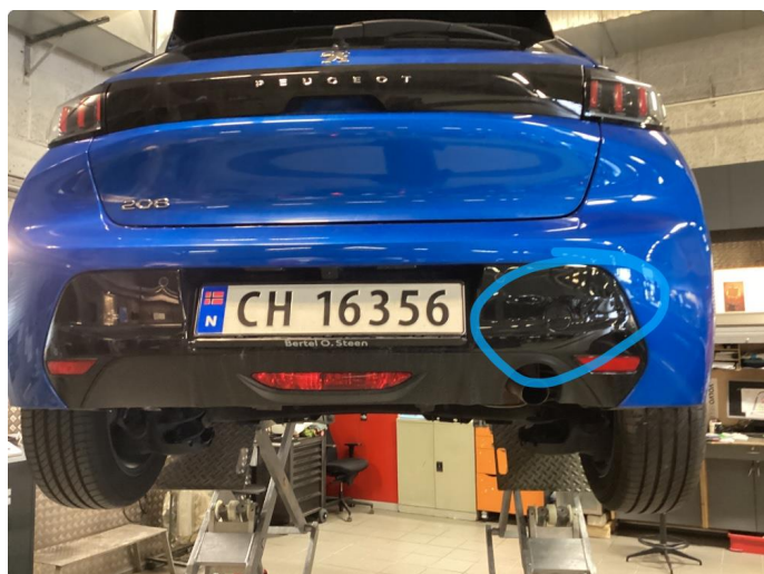
1.3 Bulk med lakkskade