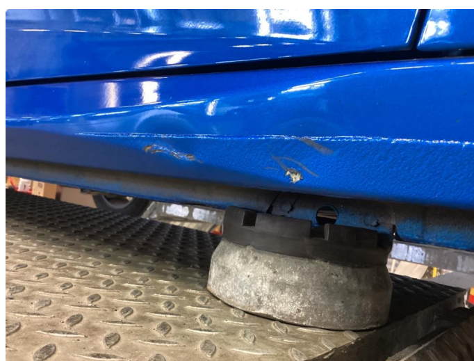
1.4 Bulk med lakkskade