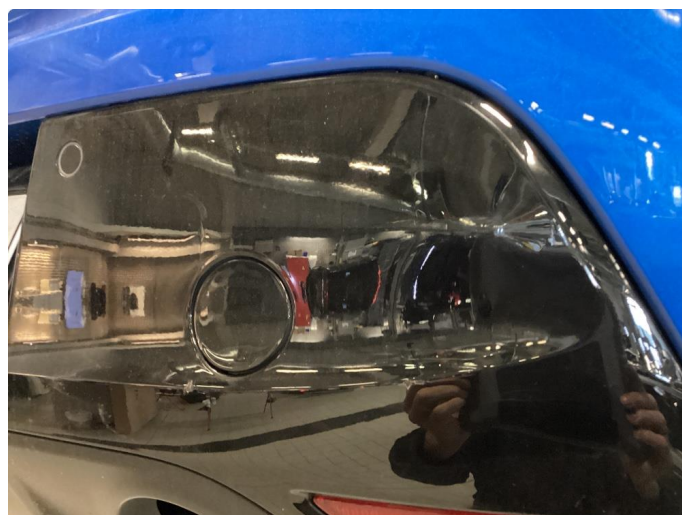
1.3 Bulk med lakkskade