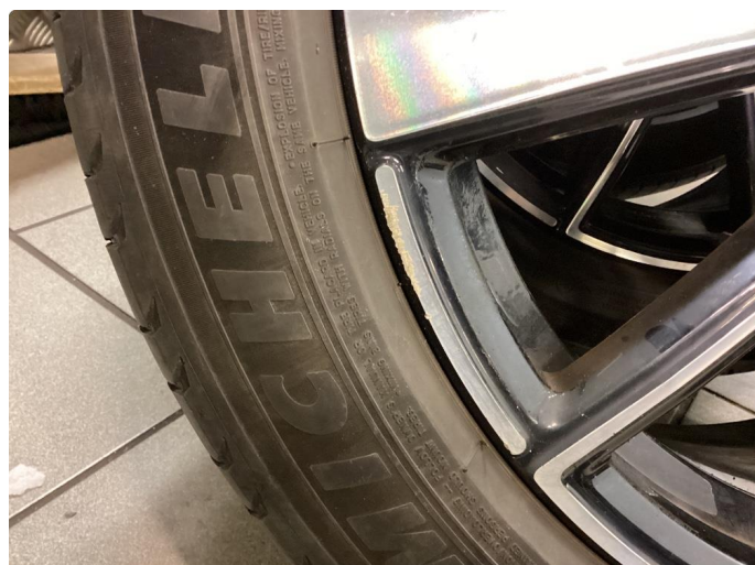
1.2 Kantkjørt felg Diamond Cut