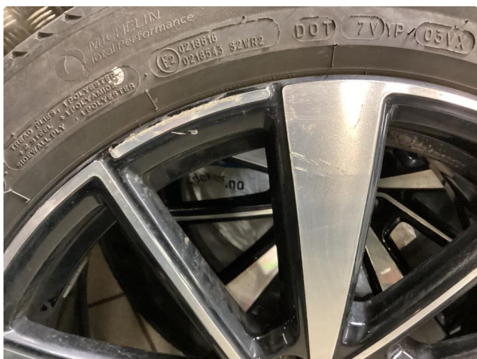
1.4 Kantkjørt felg Diamond Cut