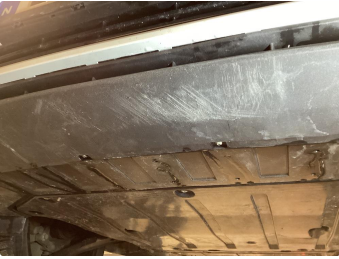
1.5 Skrubbskader underkant