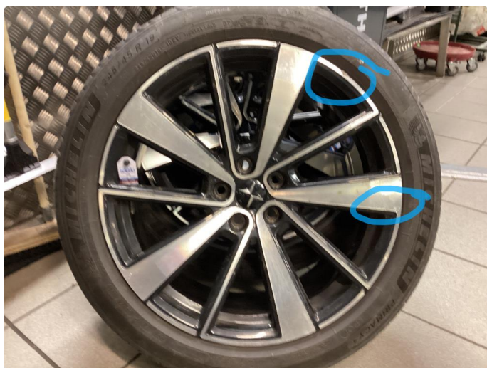
1.3 Kantkjørt felg Diamond Cut