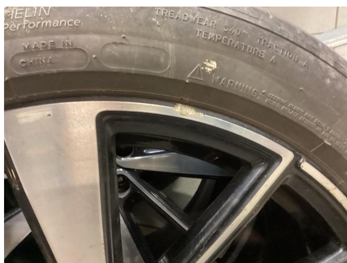
1.3 Kantkjørt felg Diamond Cut