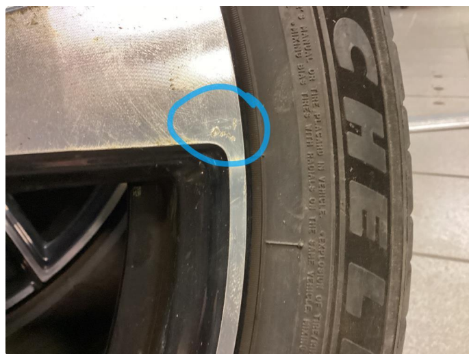
1.3 Kantkjørt felg Diamond Cut