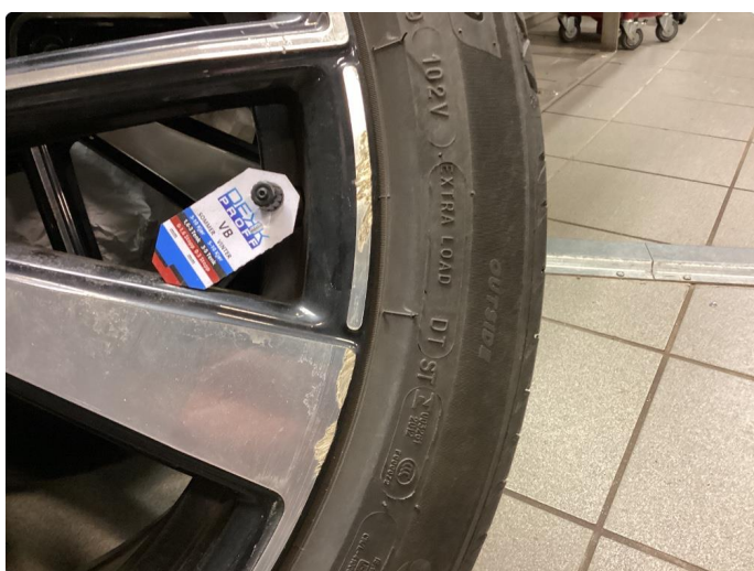
1.4 Kantkjørt felg Diamond Cut