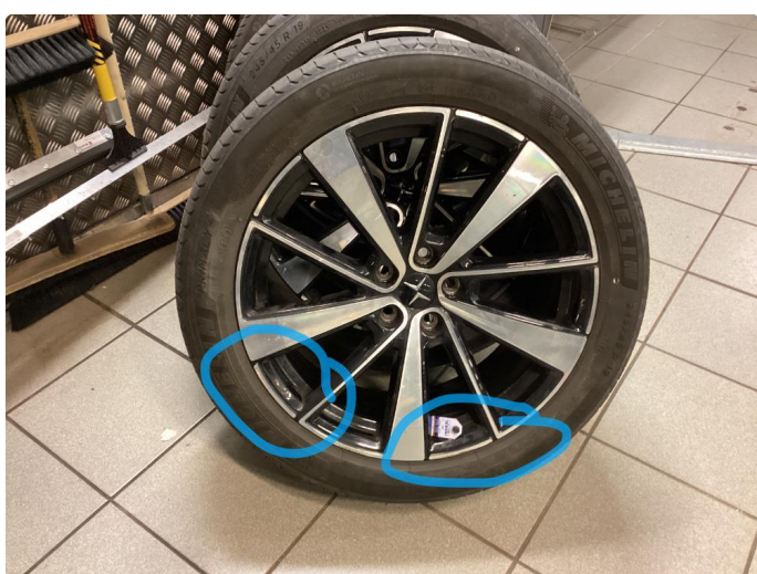
1.2 Kantkjørt felg Diamond Cut