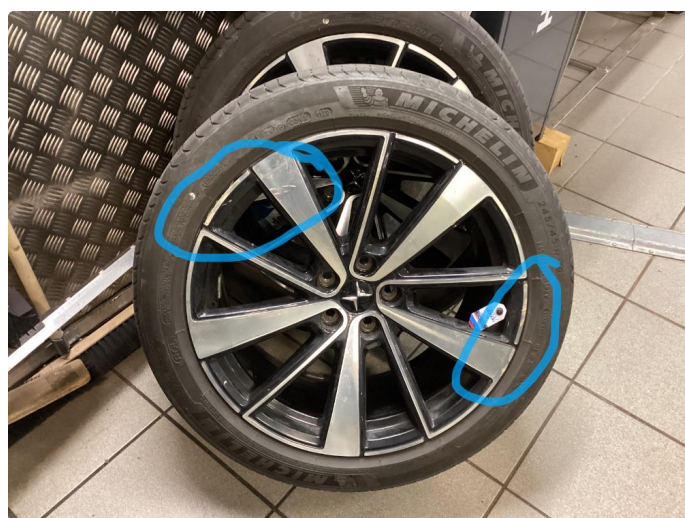
1.4 Kantkjørt felg Diamond Cut