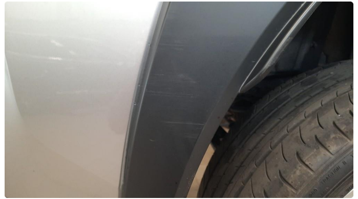
1.1 Skjermutbygger skadet