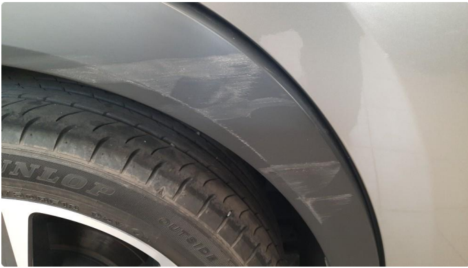
1.1 Skjermutbygger skadet