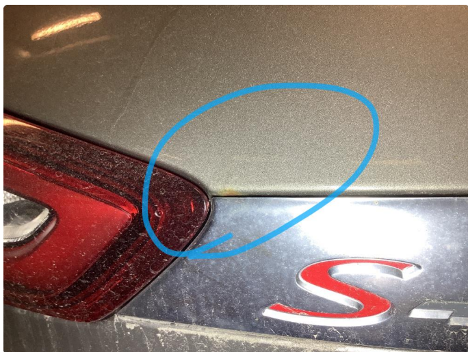
1.4 Rustbobler bakluke