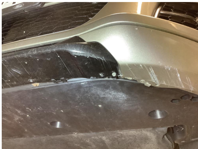
1.5 Skrubb underkant frontfanger