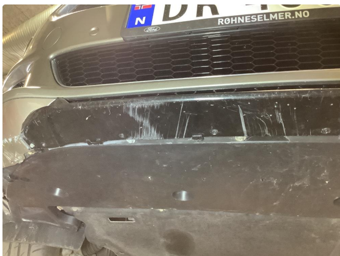
1.5 Skrubb underkant frontfanger