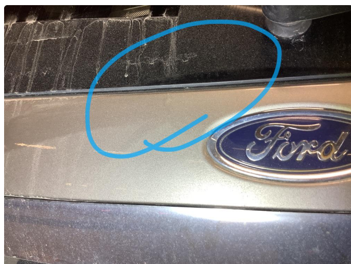
1.4 Rustbobler bakluke