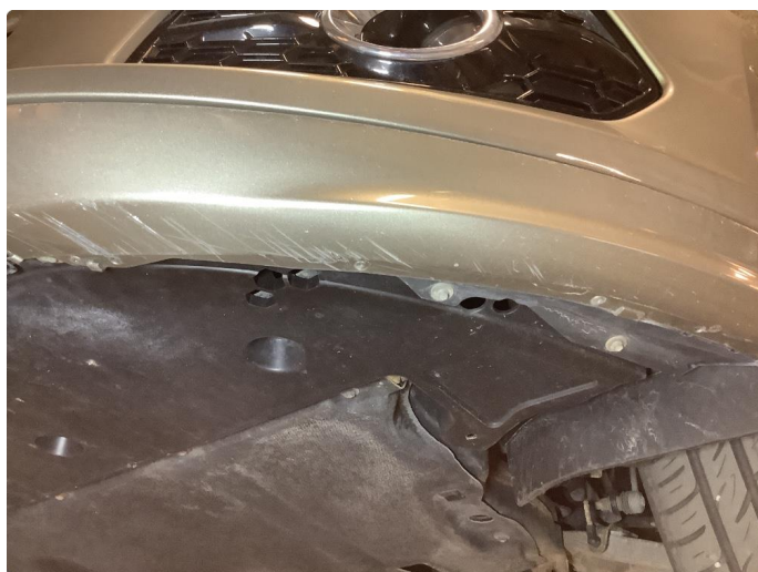
1.5 Skrubb underkant frontfanger