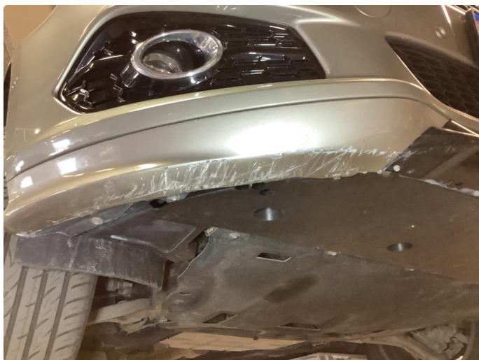
1.5 Skrubb underkant frontfanger