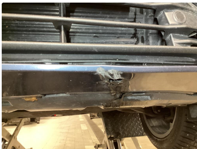
1.2 Ripe(r) ned til grunning