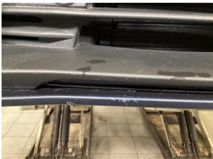
1.2 Ripe(r) ned til grunning