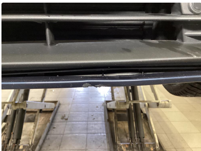
1.2 Ripe(r) ned til grunning