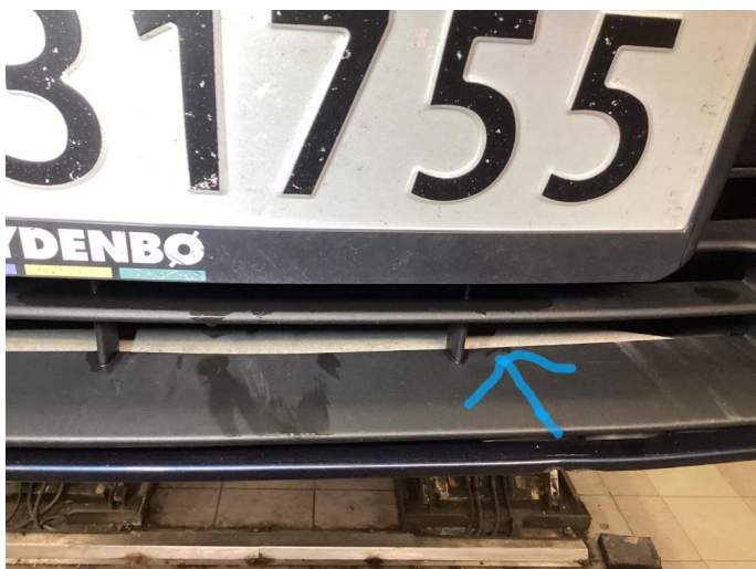
1.2 Ripe(r) ned til grunning