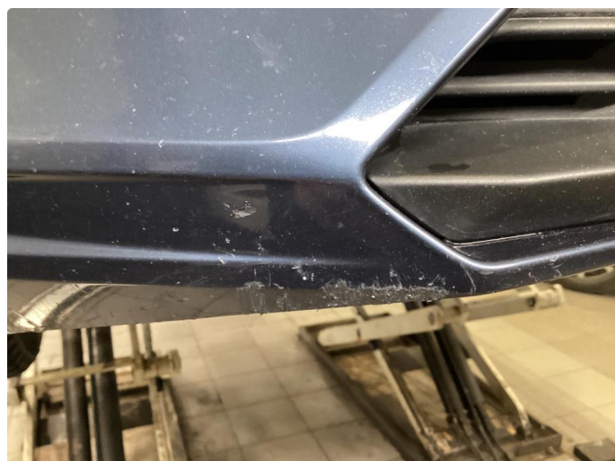
1.2 Ripe(r) ned til grunning