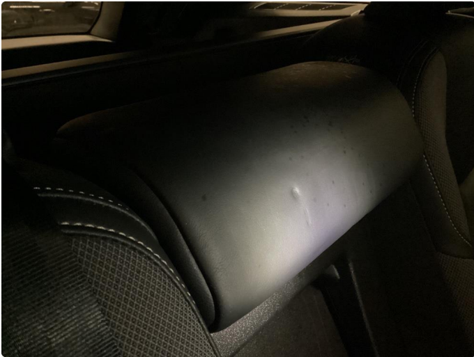
2.1 Merke på seterygg