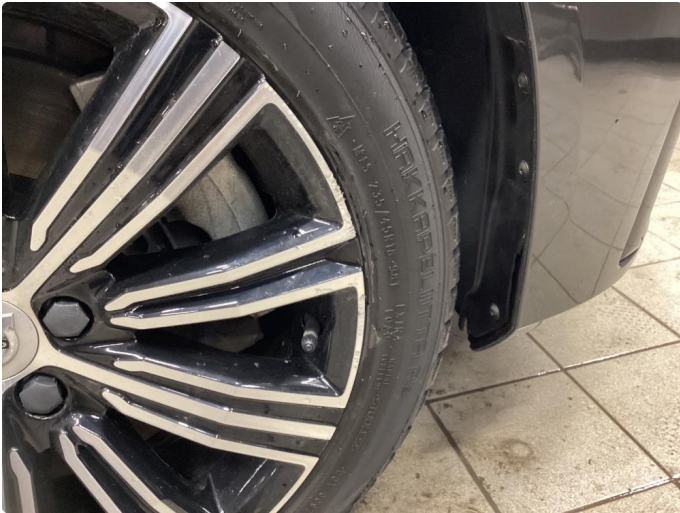
1.1 Merke felg