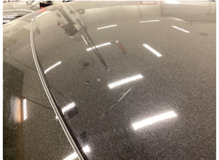
1.2 Små riper