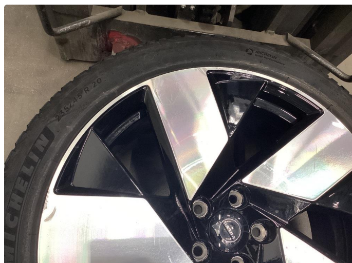
1.1 Merker på felger