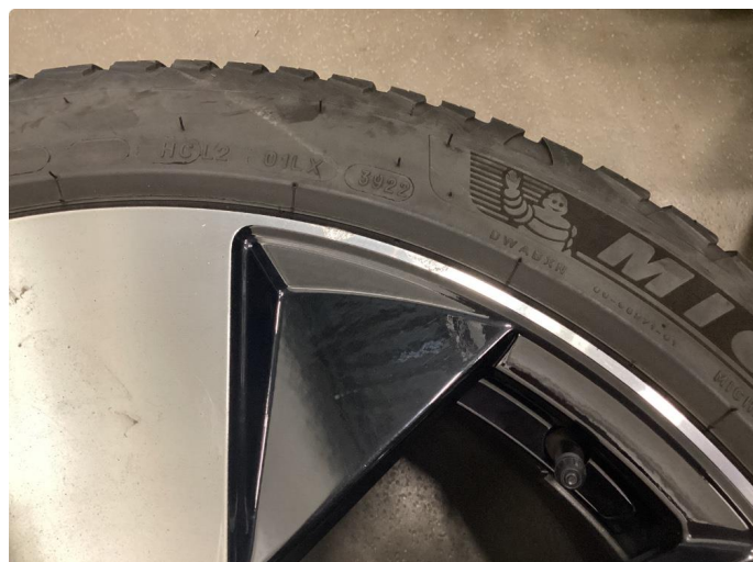
1.1 Merker på felger