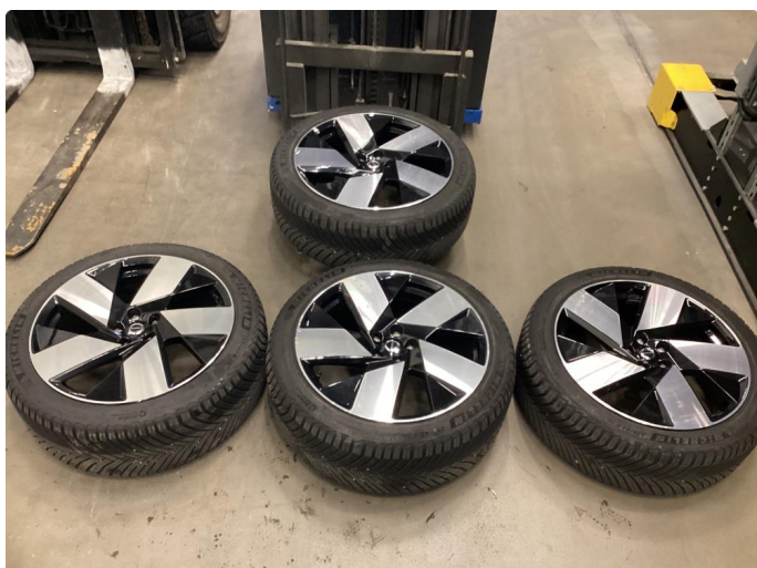
1.1 Merker på felger