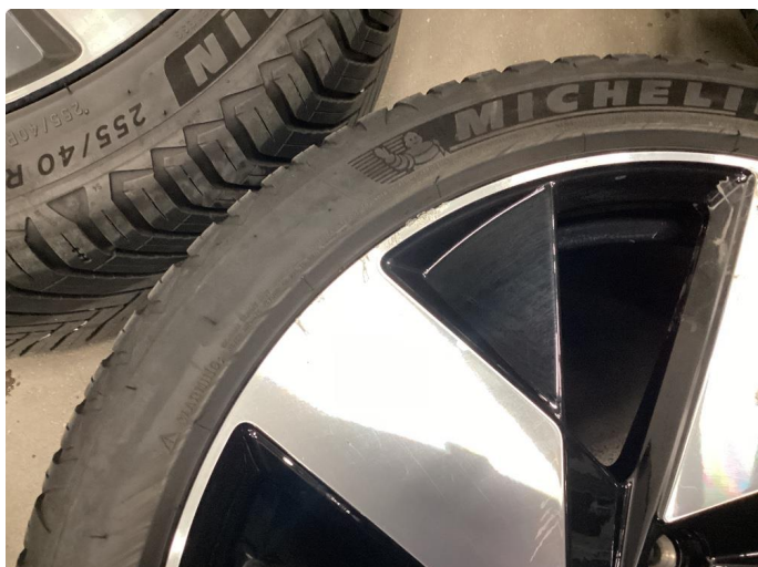
1.1 Merker på felger