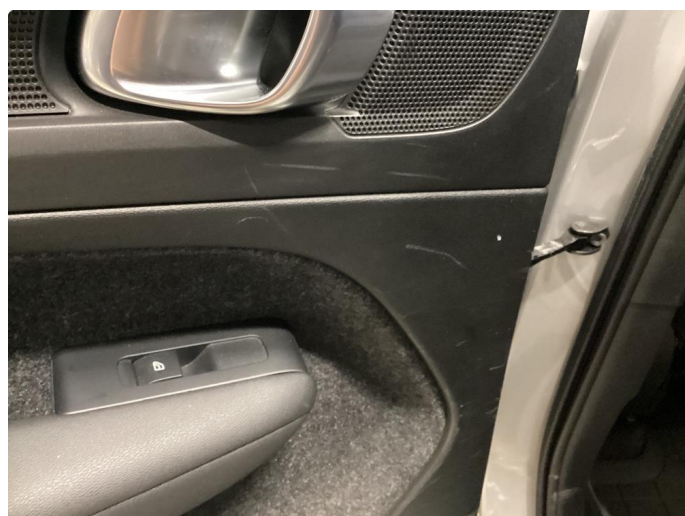
2.1 Merker innside dør