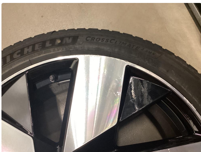
1.1 Merker på felger