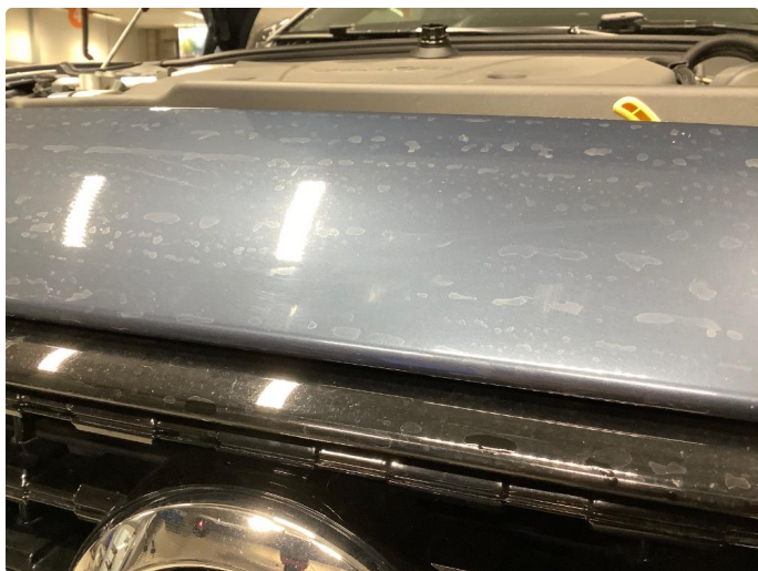
1.3 Små ripe(r)