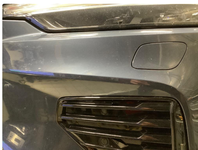
1.3 Små ripe(r)