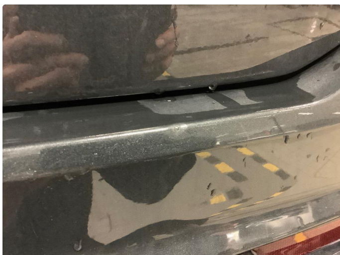
1.3 Noe skrubbermerker bafanger