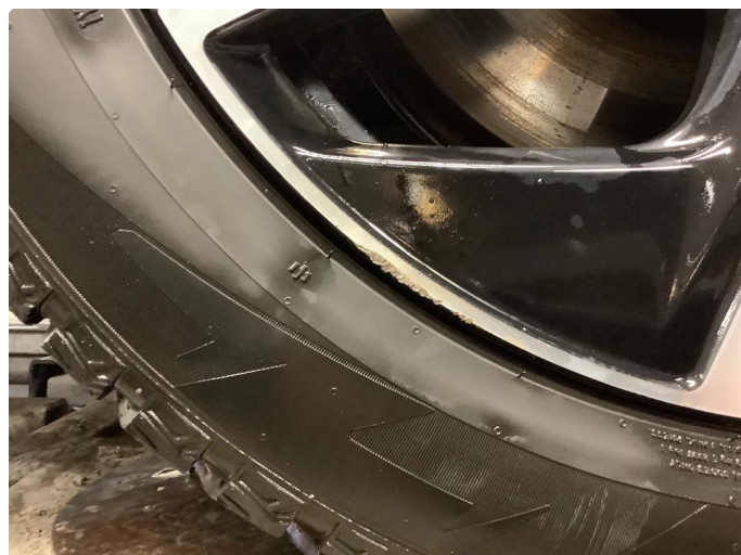
1.2 Lite merke på felg