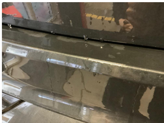
1.3 Noe skrubbermerker bafanger