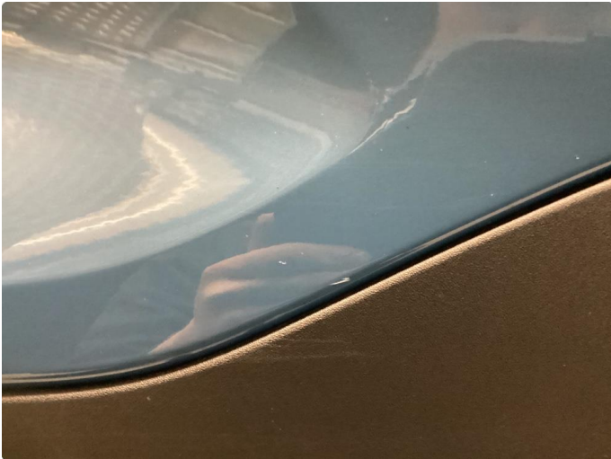
1.1 Små merker