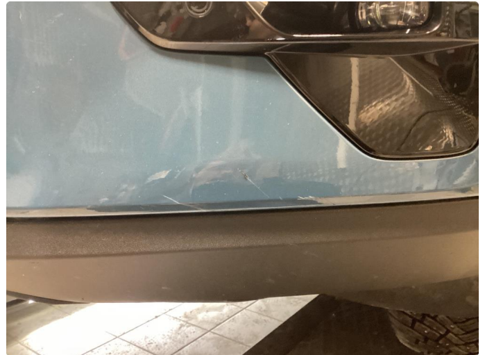
1.2 Merker front fanger