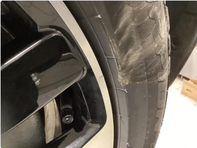
1.1 M felg Diamond Cut