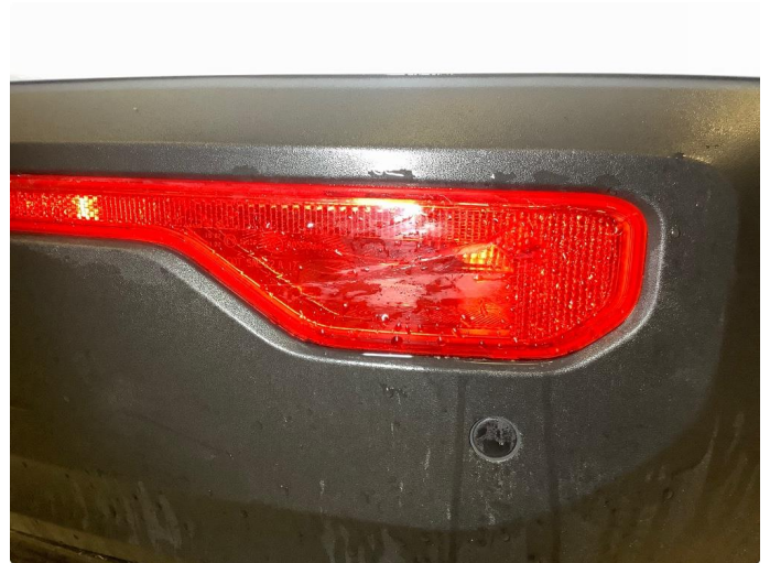
1.1 Liten skade