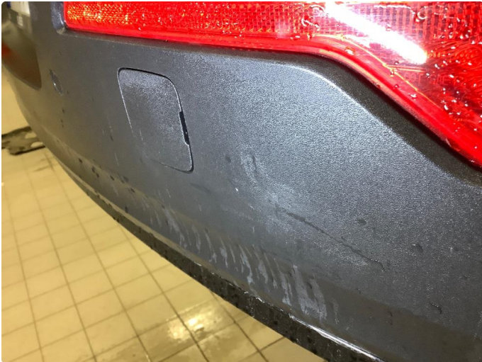
1.1 Liten skade