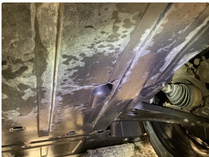
1.1 Liten sprekke i plastbeskyttelse plate under bil.