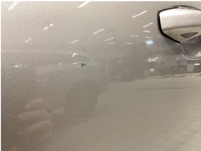
1.1 Ripe ned til grunning