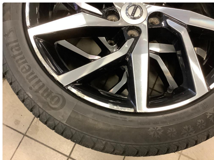
1.2 Merker i felg