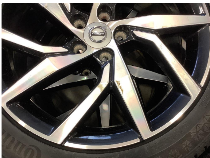
1.2 Merker i felg