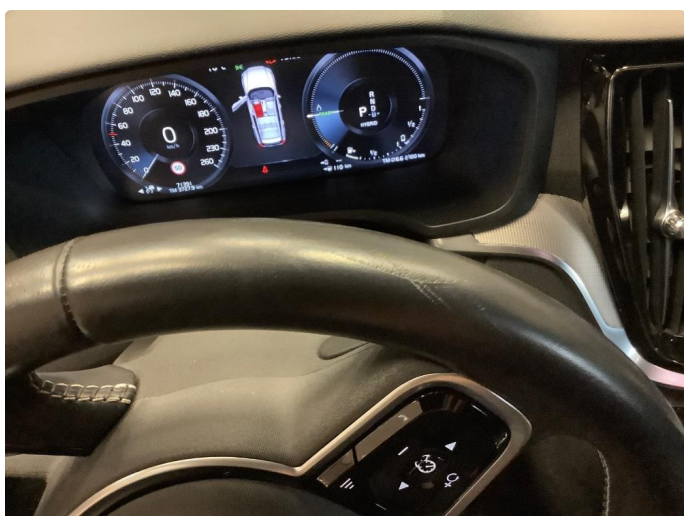
2.1 Små riper