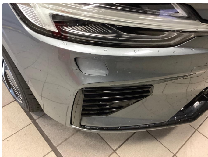
1.3 Blir reparert før overlevering