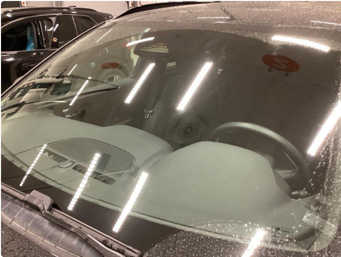
1.1 Merker etter steinsprut