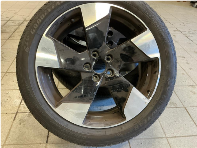
1.1 Små merker