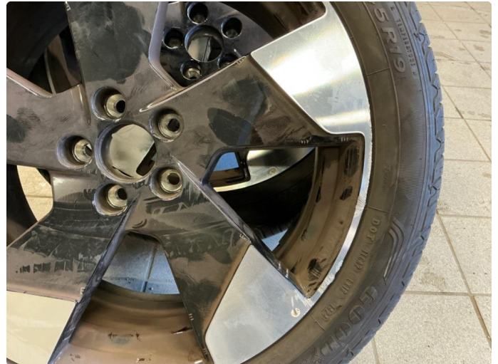
1.1 Små merker