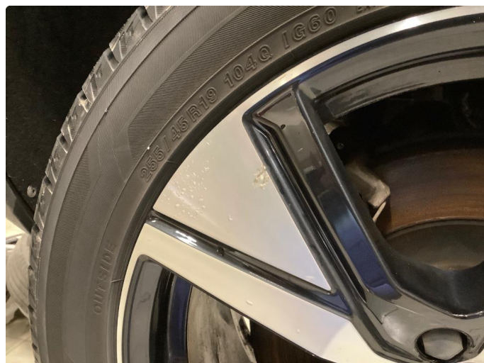
1.1 Merker på felg