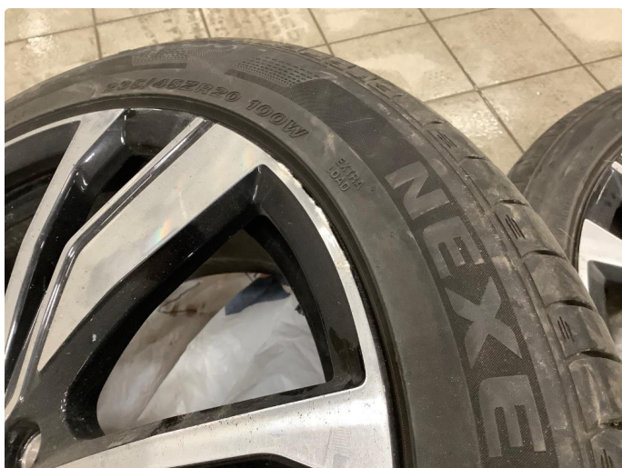
1.1 Merker på felg