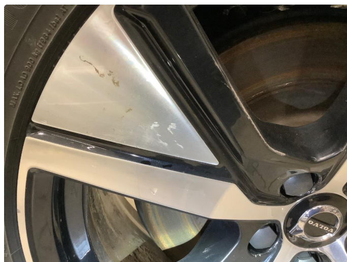
1.1 Merker på felg