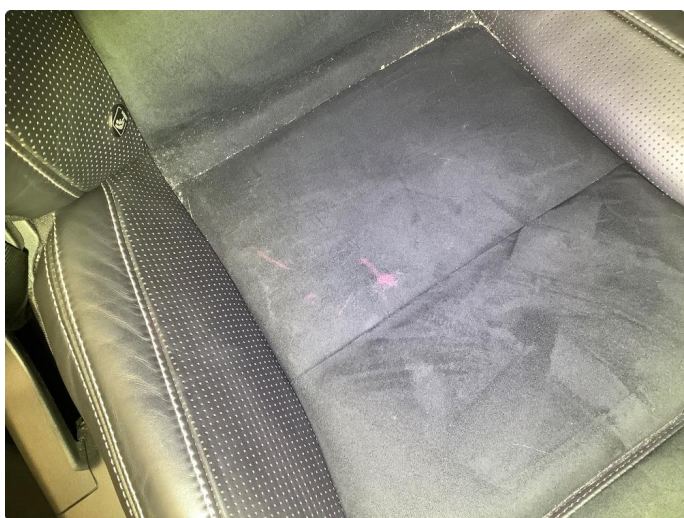
2.1 Skade på setetrek