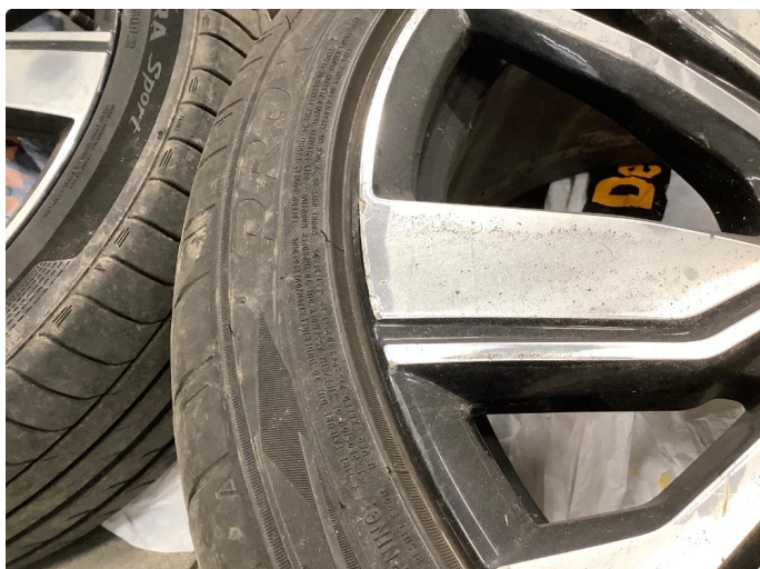
1.1 Merker på felg