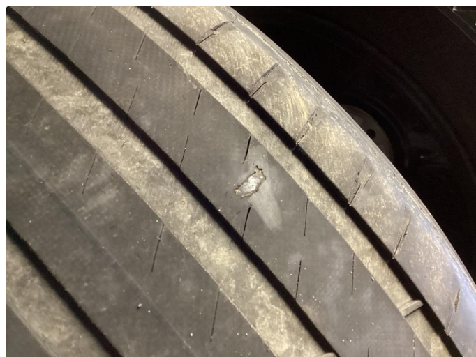
1.2 3 mm mønster, bytter til 4 nye sommerdekk