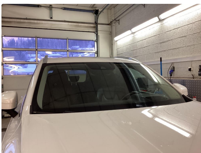
1.4 Noen små steinsprut