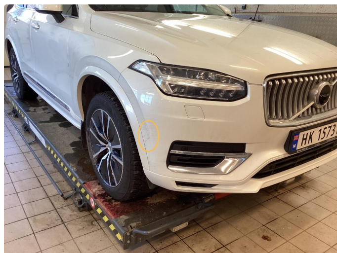
1.3 Ripe, poleres og flekklakkeres