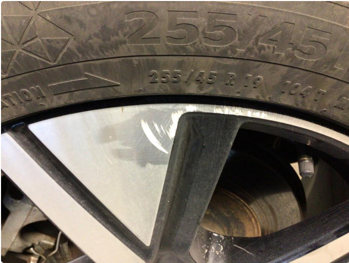
1.1 Kantkjørt felg Diamond Cut på vinterfelg bak