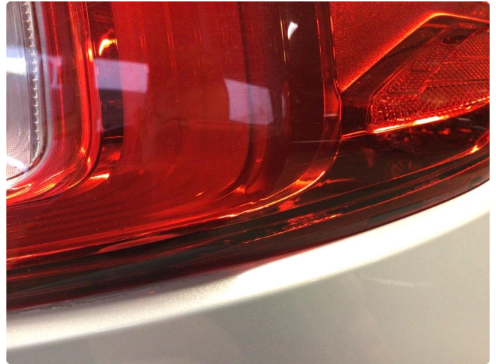
2.1 Øvrige feil