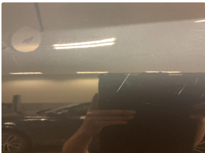
1.1 Ripe, våtslipes og poleres