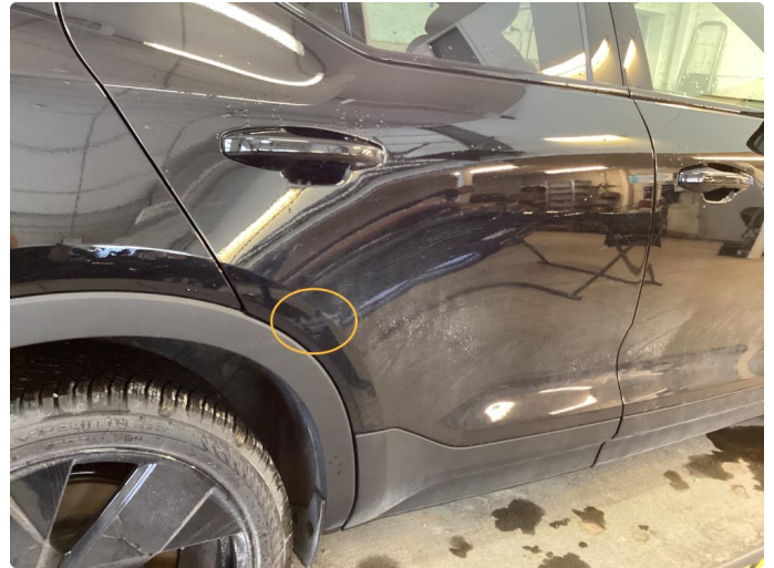
1.1 Riper som poleres før levering