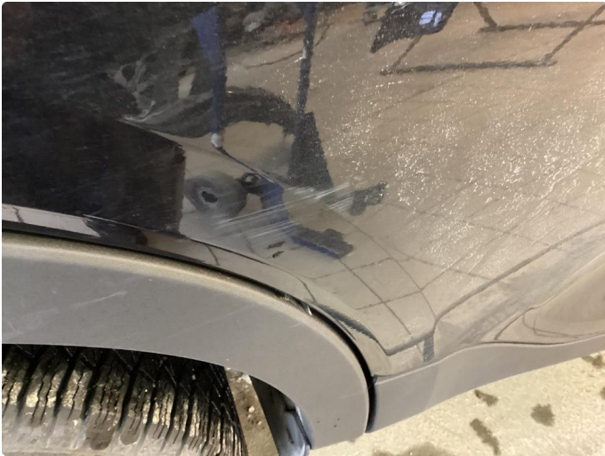
1.1 Riper som poleres før levering