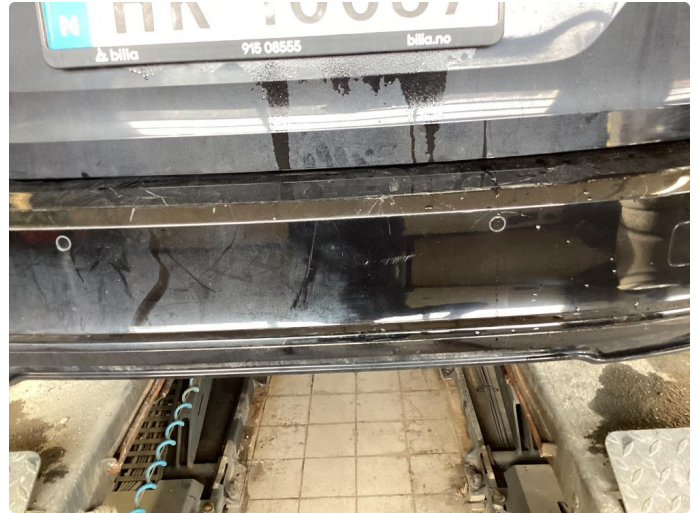
1.2 Kosmetiske ripe