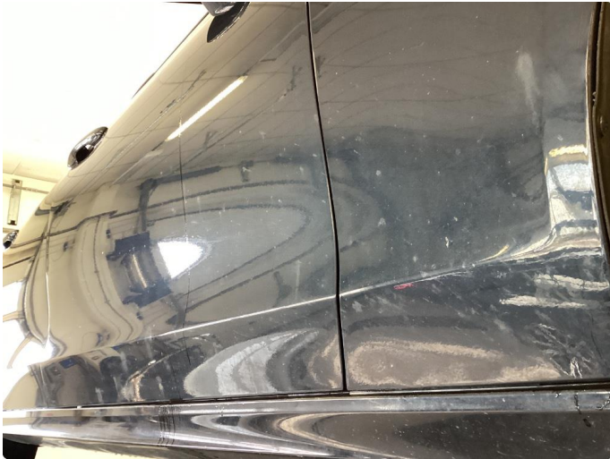
1.1 Trenger en polish før levering