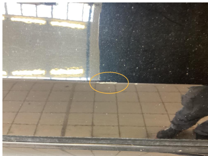
1.2 Ripe ned til grunning