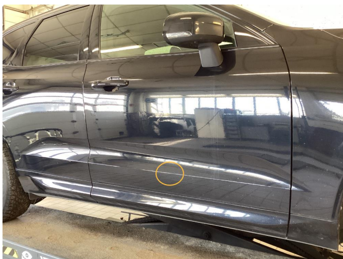
1.2 Ripe ned til grunning