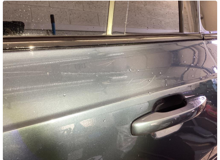
1.1 Noen bruksmerker. Bilen poleres grundig før levering.