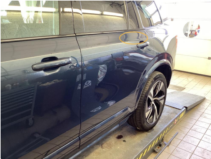
1.1 Noen bruksmerker. Bilen poleres grundig før levering.