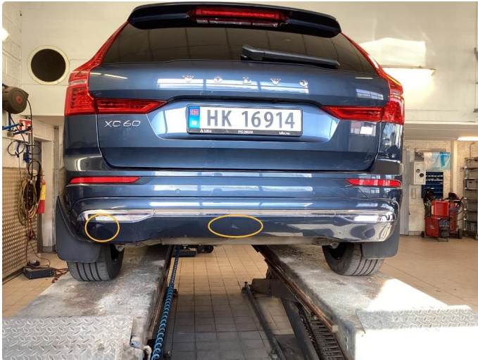
1.1 Poleres / pyntes på før levering