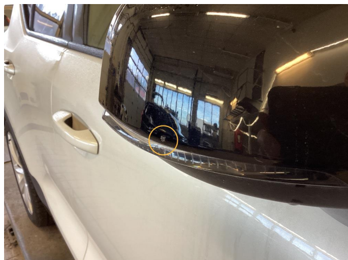
1.1 Deksel skadet/ripe