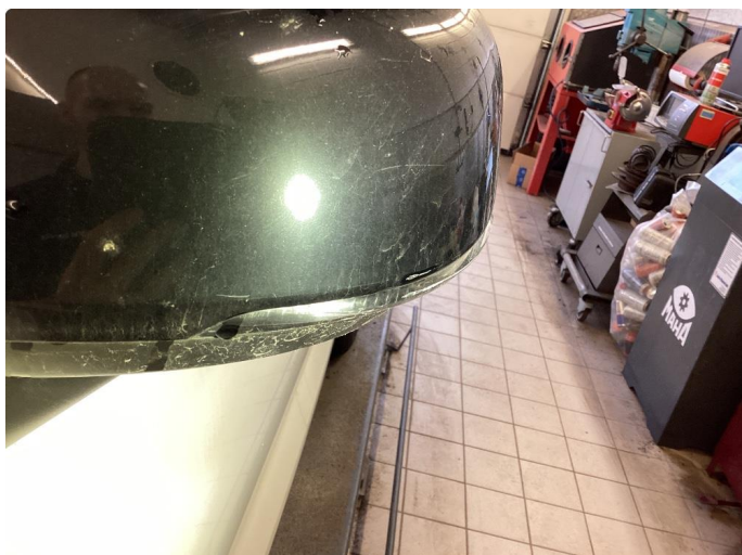
1.1 Deksel skadet/ripe