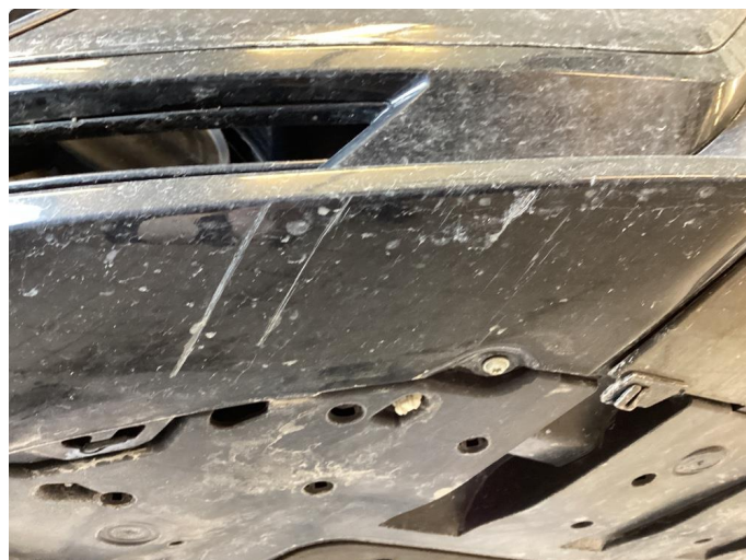
1.1 Skrubskade som ikke synes fra naturlige perspektiv.