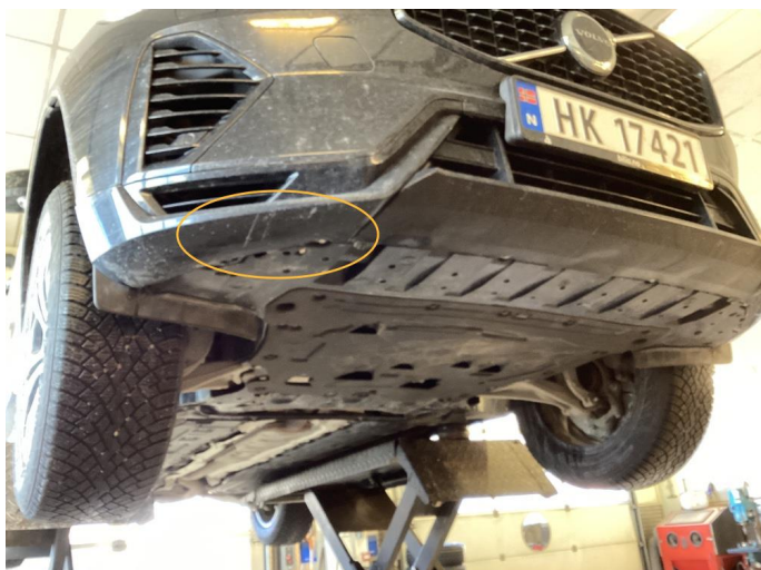
1.1 Skrubskade som ikke synes fra naturlige perspektiv.