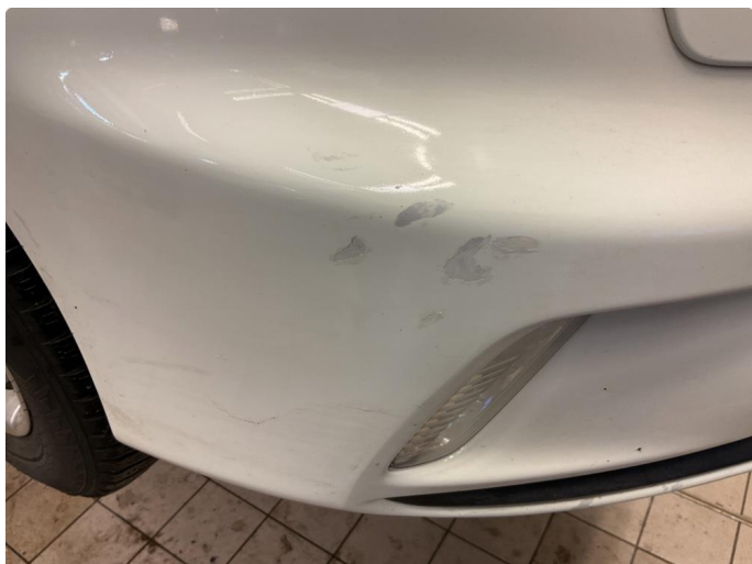
1.4 Lakk flasser