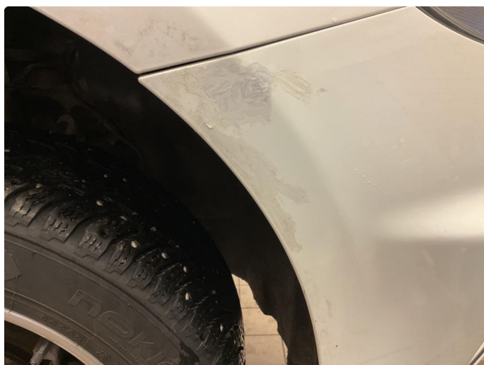
1.4 Lakk flasser