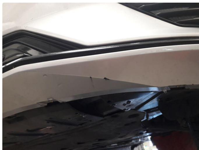
1.3 Skrubbskader underkant