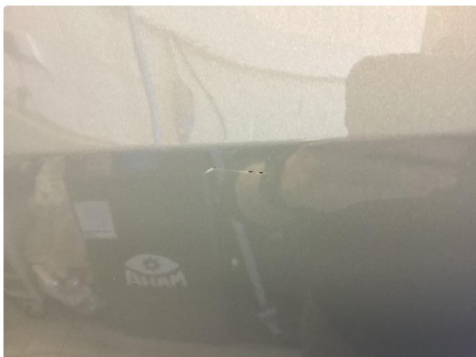
1.1 Ripe, fylt i litt lakk