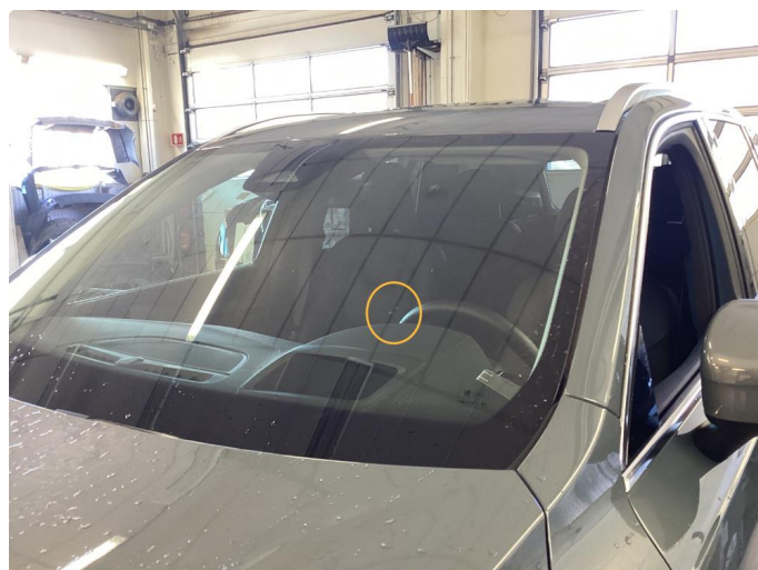
1.2 Steinsprut som er reparert/limt