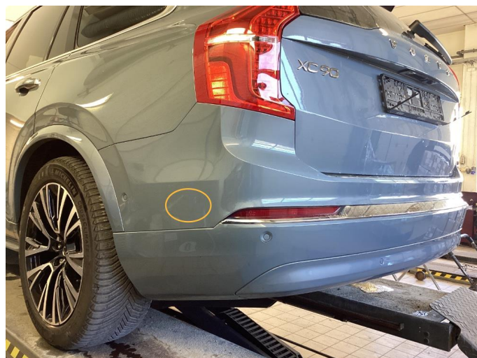
1.1 Ripe, fylt i litt lakk