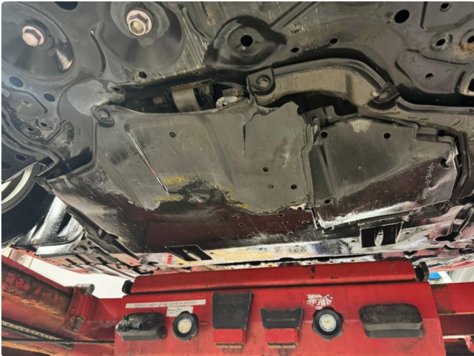
1.1 Liten skade på beskyttelsesplate under motor