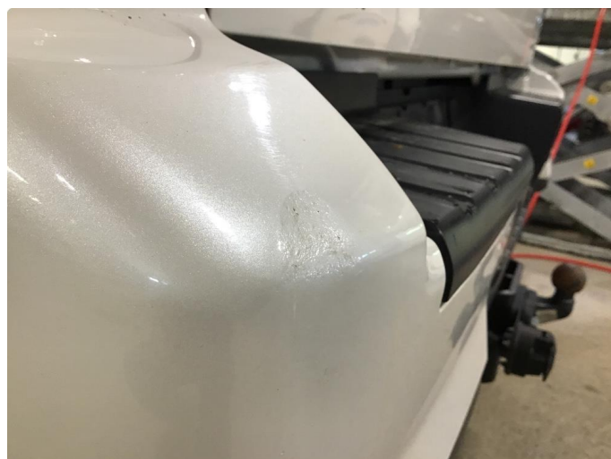
1.2 Liten skade på venstre side av støtfanger bak