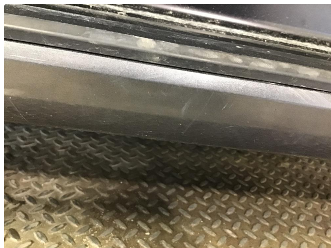
1.1 Noen steinsprang og riper i lakken