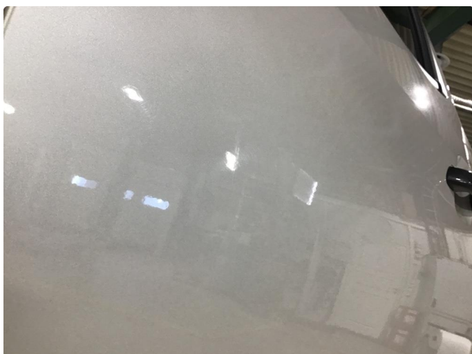
1.1 Noen steinsprang og riper i lakken