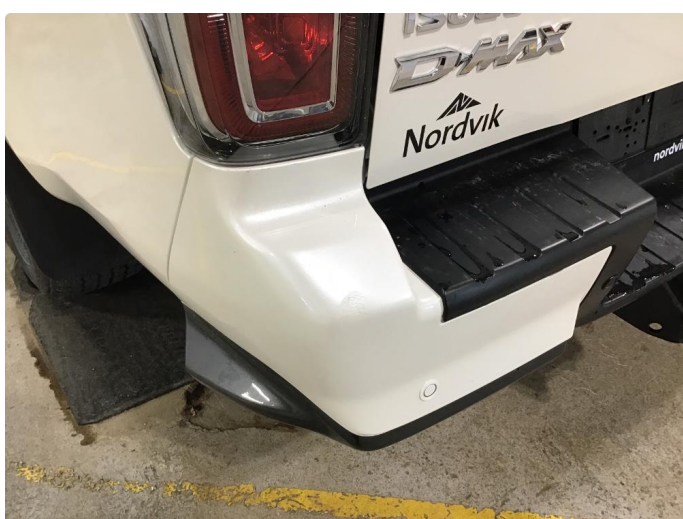
1.2 Liten skade på venstre side av støtfanger bak