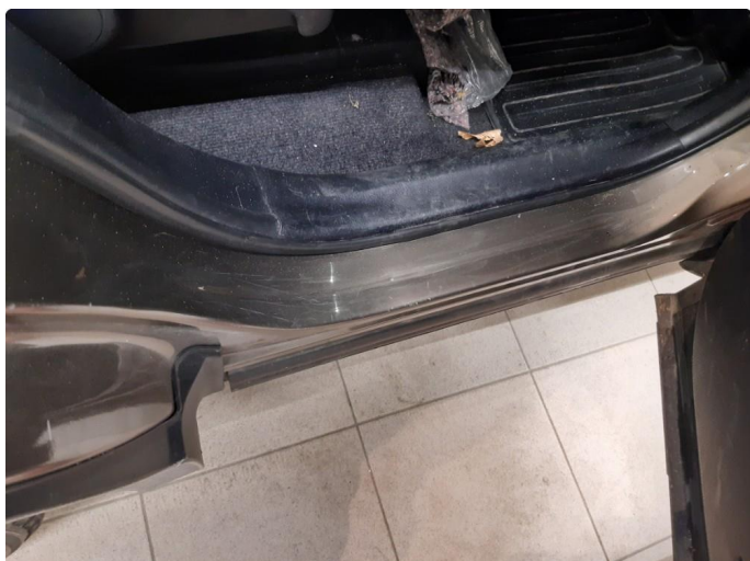
1.1 Noen riper og småbulker