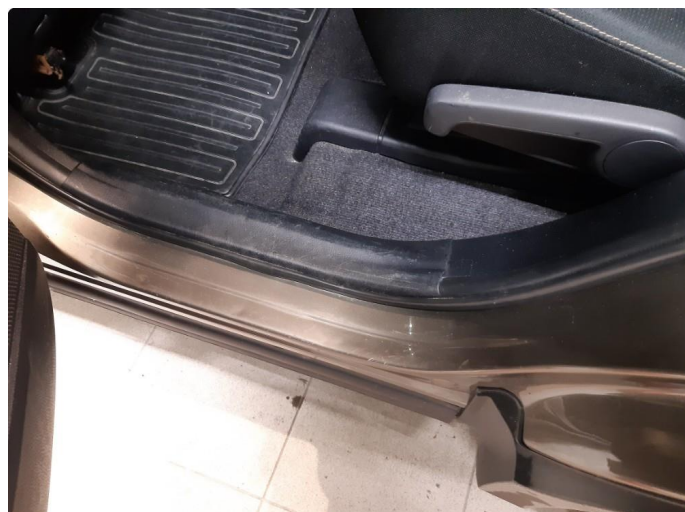
1.1 Noen riper og småbulker