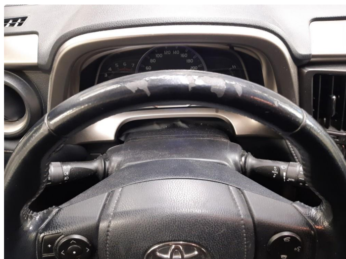
2.1 Øvrige feil