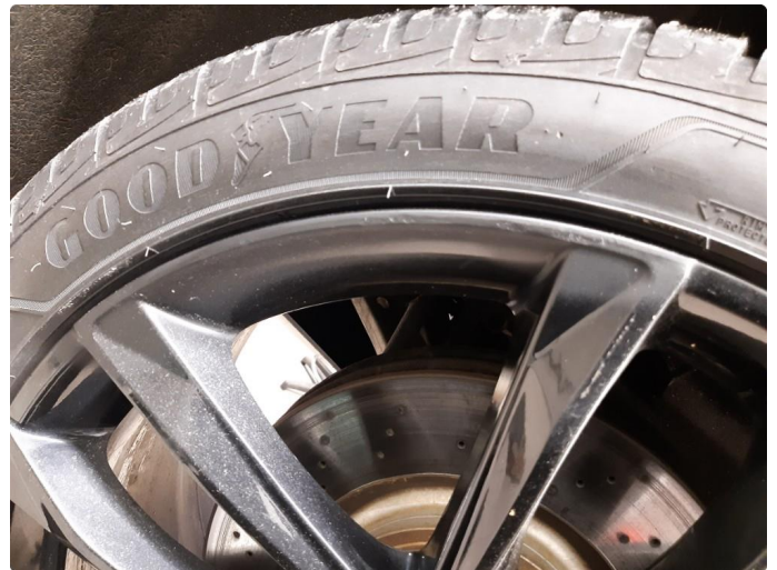
1.2 Kantkjørt felg